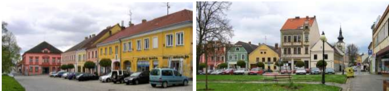
Náměstí v Kamenici nad Lipou

úzkokolejky Obrataň - Jindřichův Hradec vlastněné a provozované společností Jindřichohradecké místní dráhy. Historické jádro města je městskou památkovou zónou.